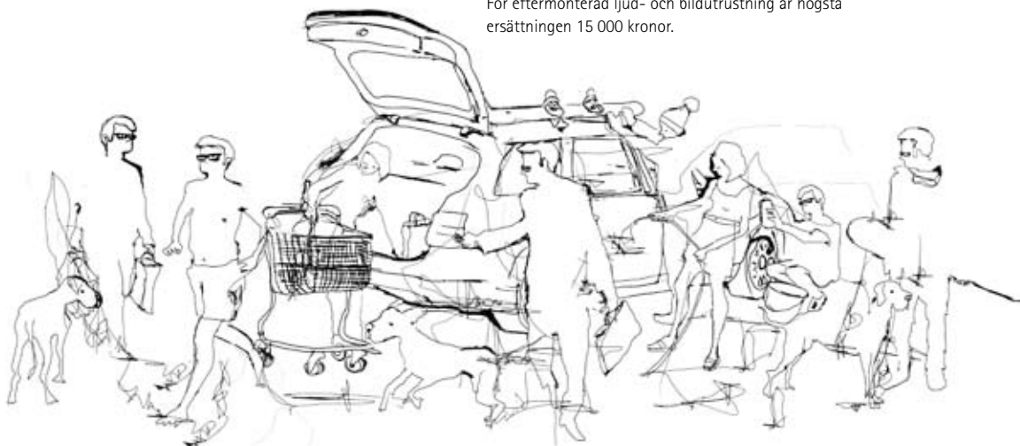
Vi gör att vardagslivet rullar.

För eftermonterad ljud- och bildutrustning är högsta ersättningen 15 000 kronor.